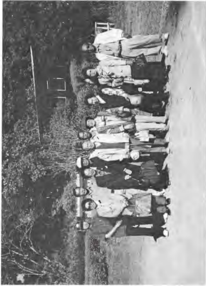
คณะที่ไปชมค่ายเสรีไทยที่จังหวัดตากถ่ายรูปร่วมกับหัวหน้าสำนักงานจังหวัดฯ และ ผู้อำนวยการศูนย์ฯ หน้าทำการศูนย์พัฒนาและสงเคราะห์ชาวเขา จังหวัดตาก