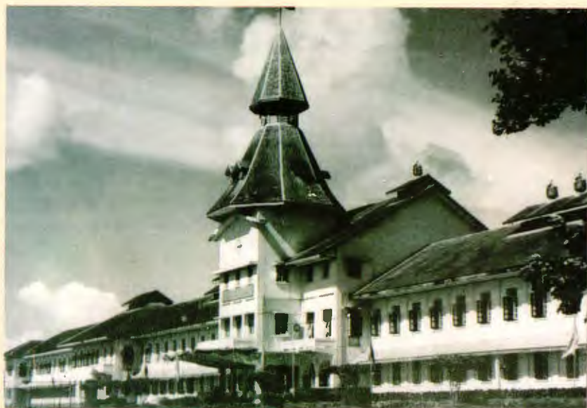
รำลึกงานวัน “ปรีดี พนมยงค์” ๑๑ พฤษภาคม ๒๕๔๐