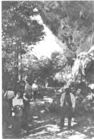
“ผาออก” ทางเข้าค่ายเสรีไทย บ้านห้วยเหล็ก