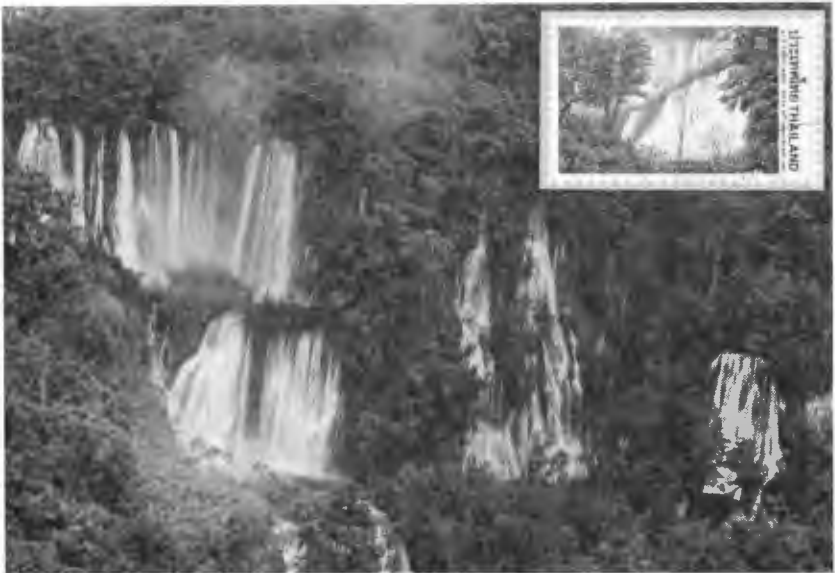
“น้ำตกทีลอซู” น้ำตกแห่งใหม่ ในจังหวัดตาก