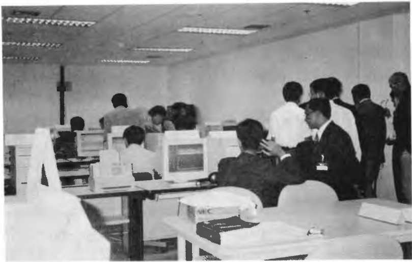
บริการห้องมัลติมีเดีย

ภาษาต่างประเทศ ๗๔๔ ชื่อเรื่อง หอสมุดแห่งนี้ได้นำ ระบบห้องสมุดอัตโนมัติแบบบูรณาการที่มีชื่อว่า Horizon มาใช้ในการดำเนินงานและให้บริการ ทำให้ผู้ใช้สามารถค้นหาสิ่งพิมพ์และวัสดุสารนิเทศที่ต้องการได้อย่างสะดวกและรวดเร็ว โดยใช้บริการสืบค้นข้อมูลด้วยระบบคอมพิวเตอร์ของห้องสมุด ซึ่งมีฐานข้อมูลเพื่อให้บริการแบ่งออกเป็น ๔ ประเภท คือ