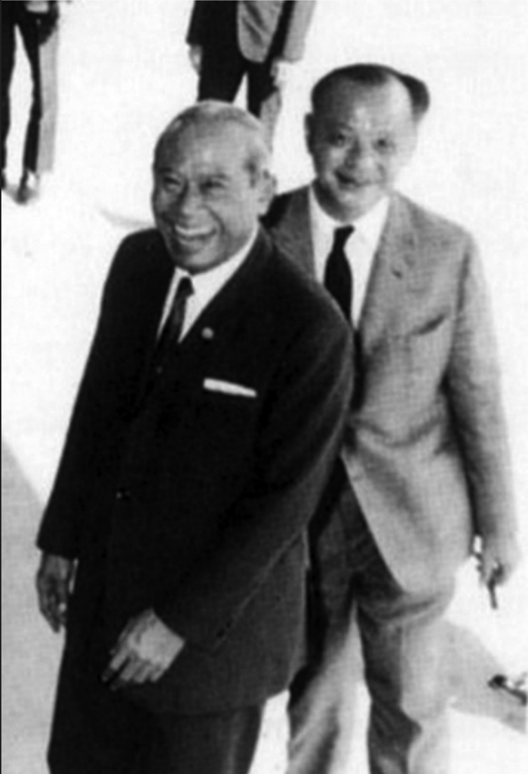
จอมพล ถนอม กิตติขจร กับป๋วย อึ๊งภากรณ์ |

บทที่ ๓ : การเมืองเรื่องการแต่งตั้งอธิการบดีมหาวิทยาลัยธรรมศาสตร์ พ.ศ. ๒๕๑๖ ระหว่างสัญญา ธรรมศักดิ์ กับป๋วย อึ๊งภากรณ์