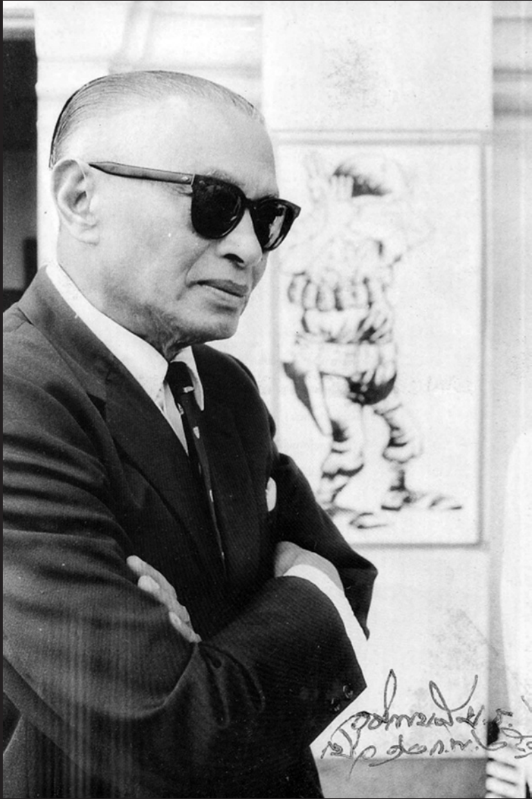
สัญญา ธรรมศักดิ์ ขณะดำรงตำแหน่ง “อธิการบดี ม.ร. เมื่อ ๑๒ ก.พ. ๒๕๑๖”

บทที่ ๕ : บทบาทสถาบันพระมหากษัตริย์กับขบวนการนักศึกษาในมหาวิทยาลัยธรรมศาสตร์ ระหว่างเหตุการณ์ ๑๔ ตุลาคม พ.ศ. ๒๕๑๖