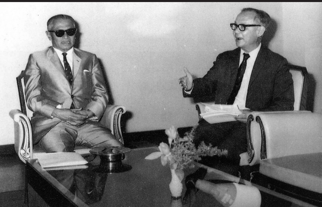
สัญญา ธรรมศักดิ์ นายกรัฐมนตรี กับป๋วย อึ๊งภากรณ์ ประธานที่ปรึกษาทางด้านเศรษฐกิจของนายกรัฐมนตรี