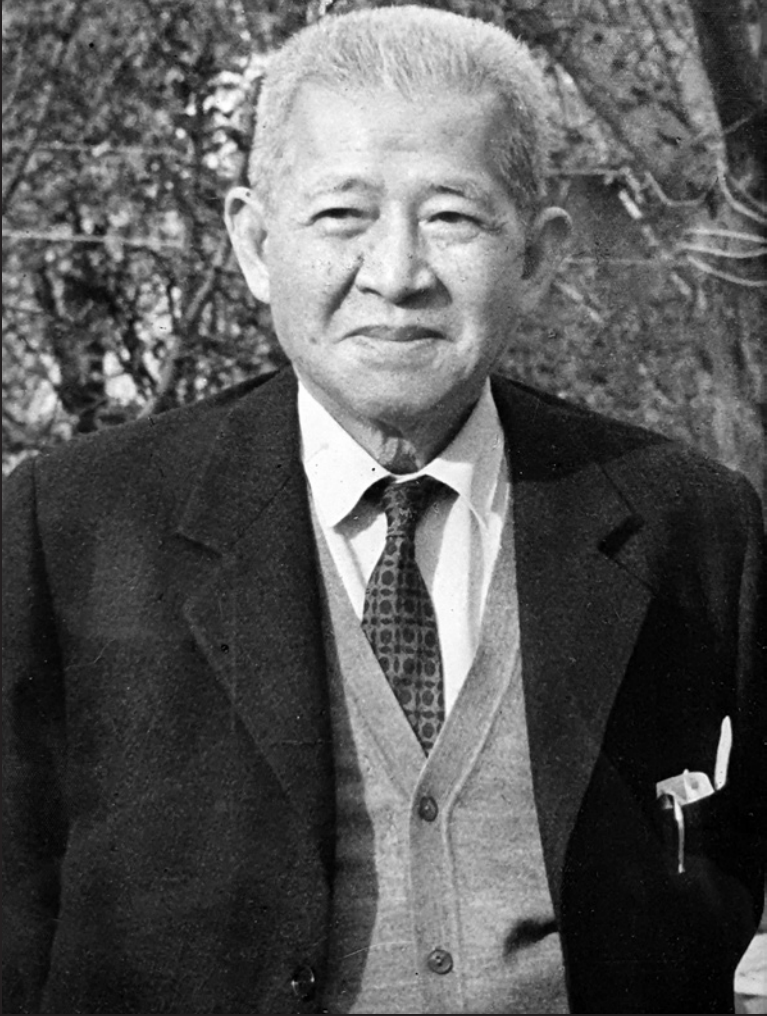
นายปรีดี พนมยงค์ (๑๑ พฤษภาคม ๒๔๔๓ - ๒ พฤษภาคม ๒๕๒๖)