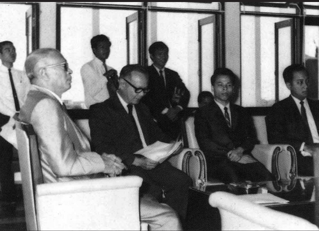
สัญญา ธรรมศักดิ์ อธิการบดีมหาวิทยาลัยธรรมศาสตร์ กับป๋วย อึ๊งภากรณ์ ศาสตราจารย์ประจำคณะเศรษฐศาสตร์