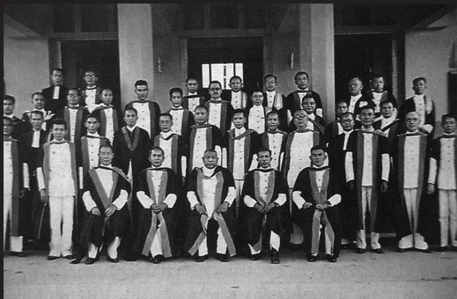
| คณะผู้ทรงคุณวุฒิ มหาวิทยาลัยวิชาธรรมศาสตร์และการเมือง ก่อน พ.ศ. ๒๔๙๐