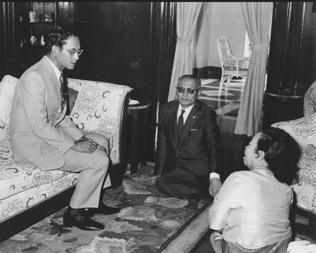
วันแต่งตั้งรัฐบาล "สัญญา ๒" วงไกลกึ่งวลา หัวหิน พ.ศ. ๒๕๑๗