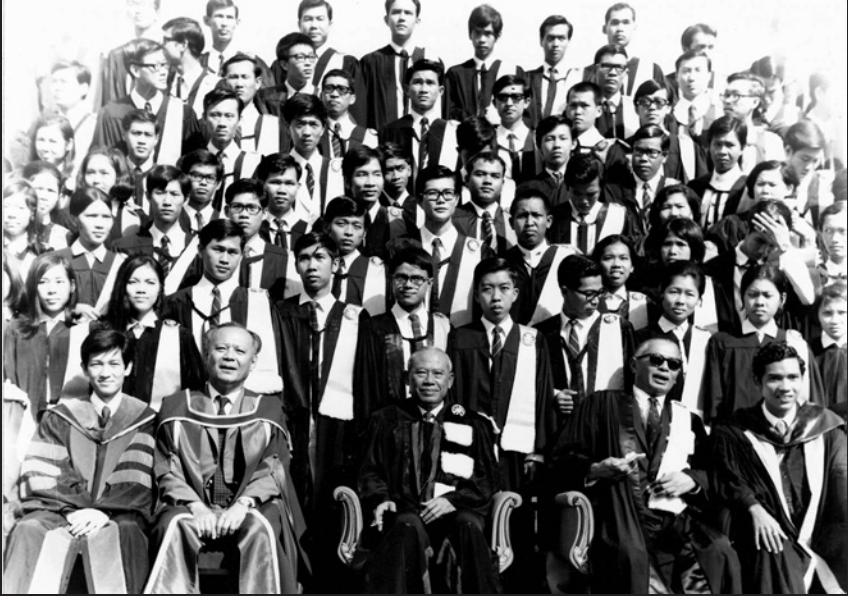
จอมพล ถนอม กิตติขจร (กลาง) กับสัญญา ธรรมศักดิ์ (ขวา) และป๋วย อึ๊งภากรณ์ (ซ้าย) ในงานพระราชทานปริญญาบัตร เมื่อวันที่ ๕ สิงหาคม พ.ศ. ๒๕๑๕