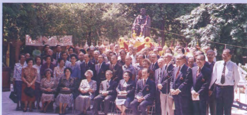
๑๑ พฤษภาคม ๒๕๓๖ ได้ร่วมไม้ร่วมมือ และหน้าอนุสาวรีย์