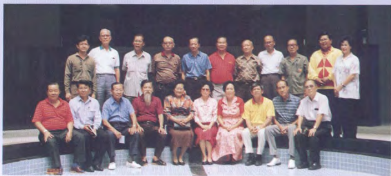
สถาบัน ปรีดี พนมยงค์ ๖๕/๑ ซอยทองหล่อ สุขุมวิท ๕๕ กทม.