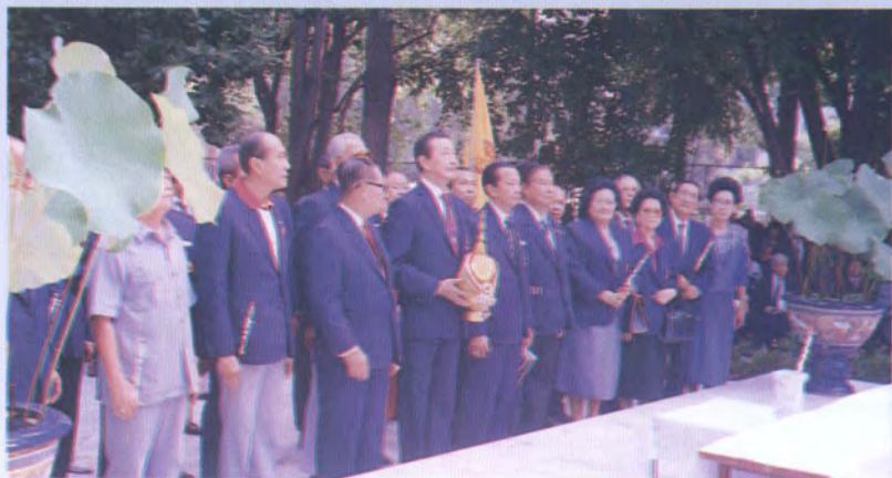
ชมรม ต.ม.ธ.ก.สัมพันธ์ วางพุ่มดอกไม้ และองค์ปาฐก หน้าอนุสาวรีย์