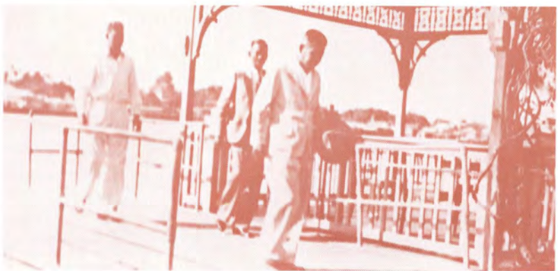
ระหว่างการปรึกษาข้อราชการ และหารื่องานของเสรีไทย