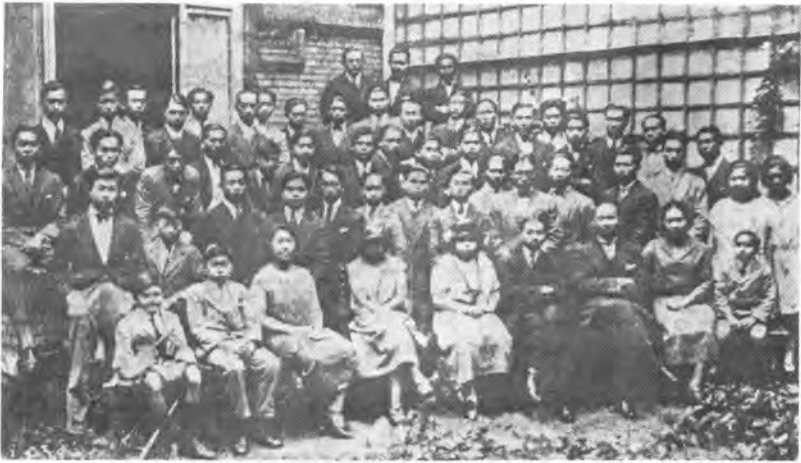
พระบาทสมเด็จพระปกเกล้าฯ และสมเด็จพระนางเจ้ารำไพพรรณี ท้ามกลางพระบรมวงศานุวงศ์ และคนไทยในกรุงปารีส เมื่อ พ.ศ. ๒๔๖๐