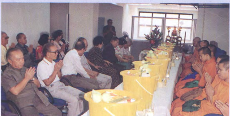
พระภิกษุสงฆ์สวดมนต์เพื่อเป็นสิริมงคล และร่วมกันถวายสังฆทาน ที่สถาบัน ปรีดี พนมยงค์ เมื่อวันที่ ๑๐ กุมภาพันธ์ ๒๕๓๗