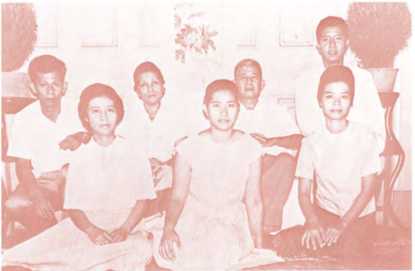
ภาพครอบครัวพร้อมหน้าของท่านผู้ประศาสน์การ ระยะเวลา ในต่างประเทศ