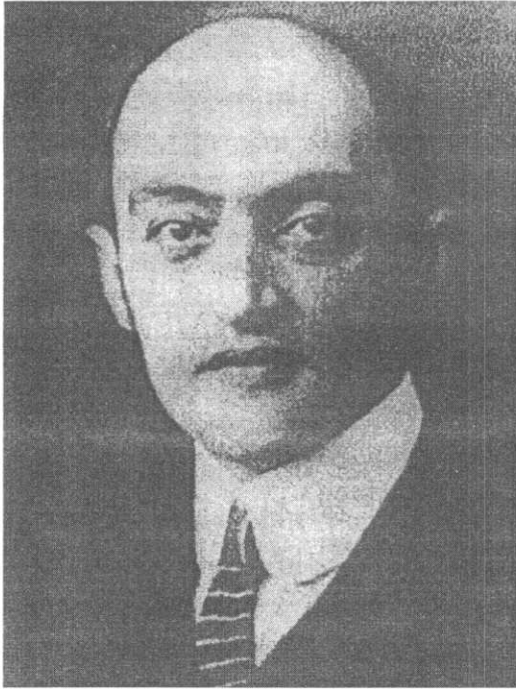
ศาสตราจารย์โจเซฟ ชุมปีเตอร์ (Joseph Schumpeter)

อย่างไรก็ตาม ถึงแม้ว่าชาร์ลส์ จิต จะได้เรียบเรียงตำราเศรษฐศาสตร์ที่ได้รับความนิยมสูงสุดในฝรั่งเศส หรือแม้กระทั่งในโลกในสมัยนั้นเล่มหนึ่ง เมื่อพิจารณาถึงจำนวนครั้งที่มีการพิมพ์ออกสู่ตลาดที่ครอบคลุมระยะเวลายาวนาน แต่ก็มิได้รับการยกย่องว่าเป็นนักเศรษฐศาสตร์ที่ยิ่งใหญ่ในประวัติศาสตร์ทฤษฎี