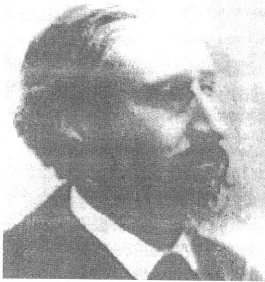
ศาสตราจารย์ชาร์ลส์ จีด์ (Charles Gide) ผู้เขียนตำรา “หลักเศรษฐศาสตร์”

ศาสตร์” ของชาร์ลส์ จีด์ ว่าเป็นตำราเศรษฐศาสตร์เบื้องต้นก็จะต้องไม่ถูกต้อง เพราะผู้เรียบเรียงได้ลงไปประเด็นต่างค่อนข้างจะลึก ซึ่งส่วนใหญ่เป็นการแสดงความคิดเห็นที่คมคายและน่าคิด